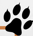
Table des matières